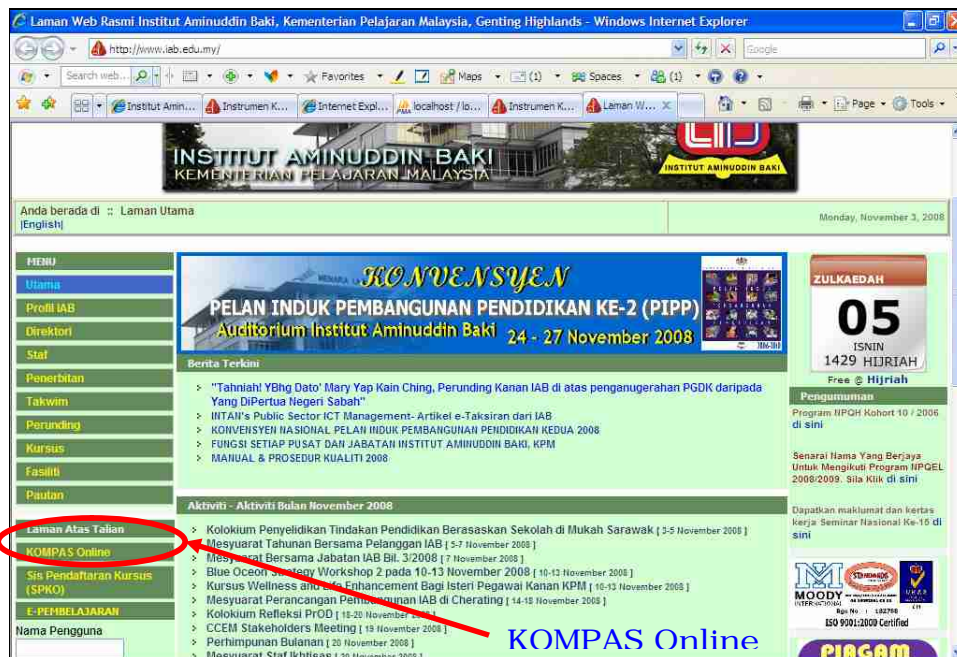
Rajah 1: Laman Web Rasmi IAB