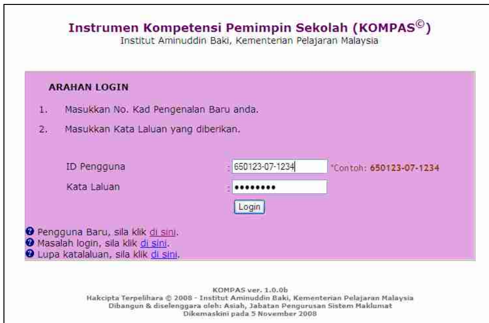
Rajah 5: Paparan Login